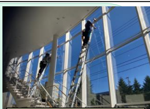
ガラスクリーニング施工中