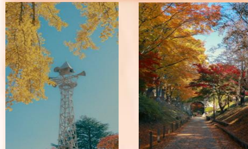
城跡公園のトンネルから