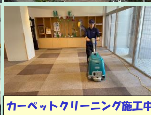
カーペットクリーニング施工中